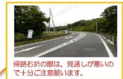
併路右折の際は、見通しが悪いので十分ご注意ください。