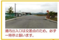
場内出入口は交差点のため、必ず一時停止願います。