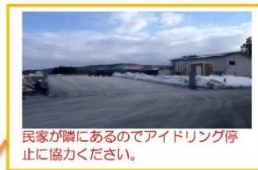
民家が隣にあるのでアイドリング停止に協力ください。